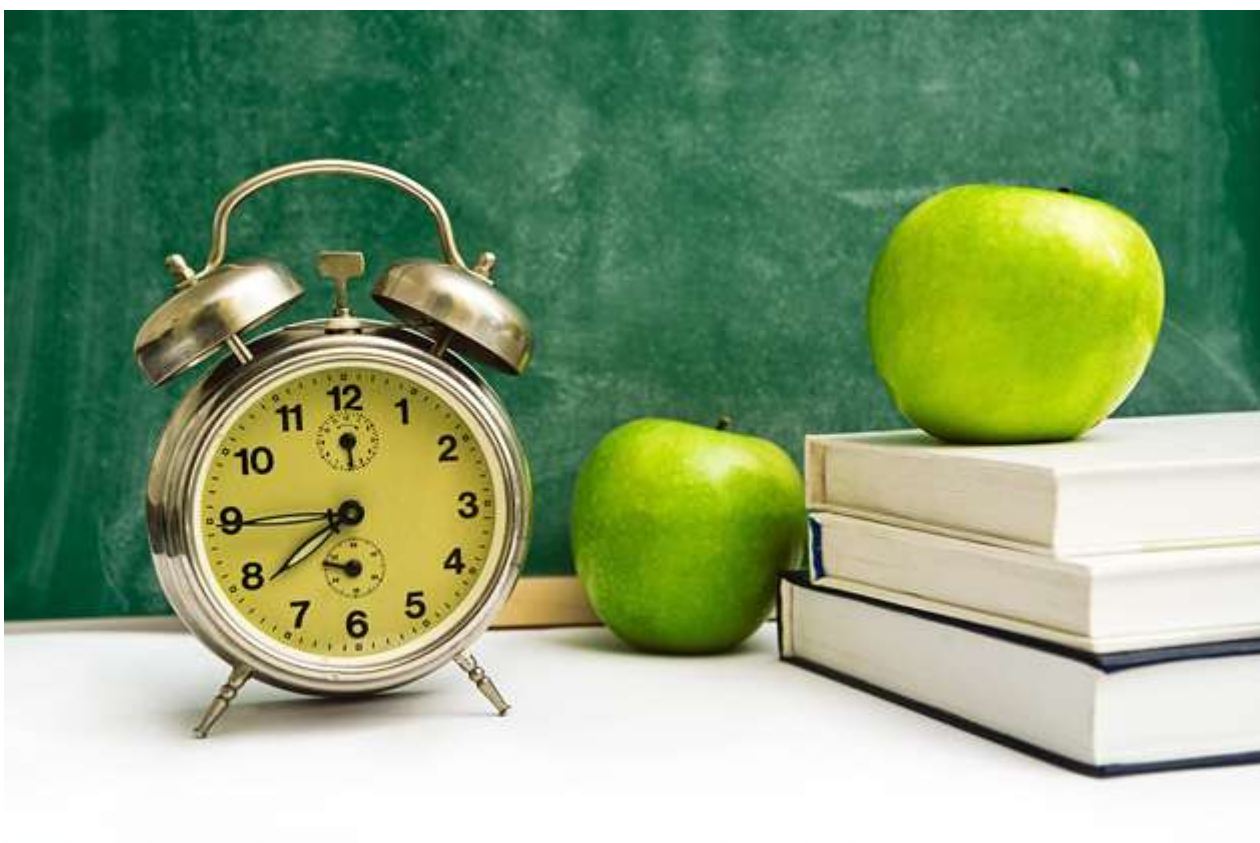
Будильник – неотъемлемая составляющая учебного процесса

Как сделать так, чтобы этот период прошел максимально гладко? Давайте разберемся вместе!