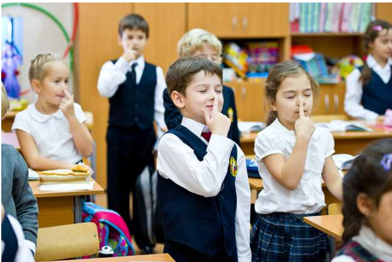
Первоклассники знакомятся с первыми ощущениями

В связи с безотметочной системой на первых порах, советую не настраивать ребенка на получение оценок. «Дети, собираясь в школу, слышат «пойдешь в школу – будешь получать пятёрки...» – этими словами мы всё и портим. Маленький ученик с первых дней ждёт, когда же ему поставят отметку, а её всё нет; родственники постоянно спрашивают, что получил сегодня в школе, а это неправильный вопрос в корне. Необходимо попробовать себя перестроить. Научиться задавать правильные вопросы. Что интересного сегодня было в школе? Что ты узнал?»